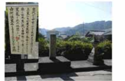
⑧ 糸我の道標 ⑨ 徳本上人号碑