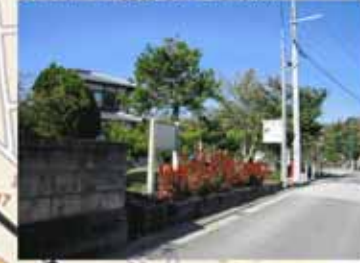
⑥ 11:30 日本最古の糸我稲荷神社