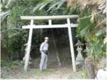
⑨ 14:25 内ノ畑王子跡