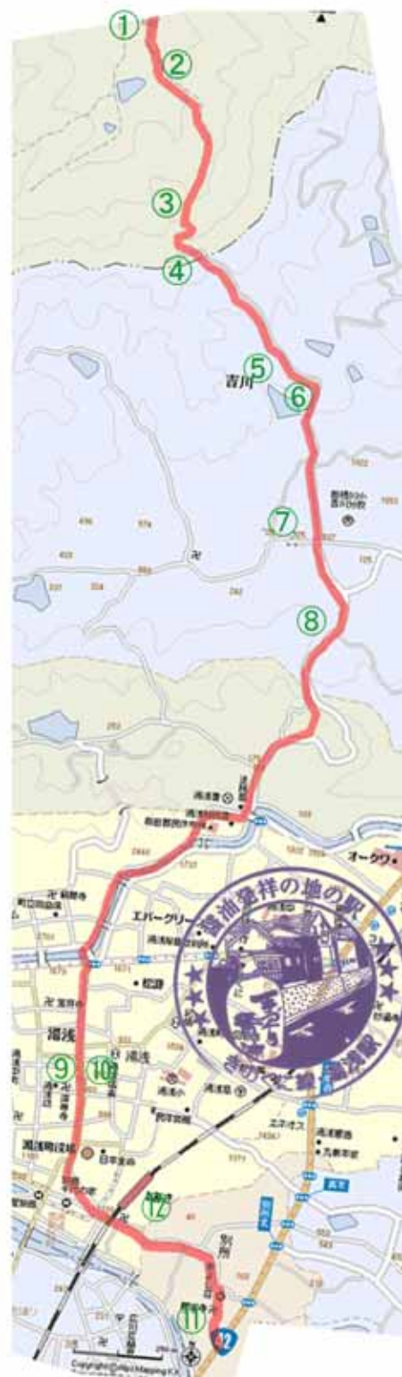
⑦ 12:55 逆川王子社