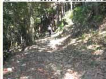
⑬ 12:15 金魚茶屋跡でやっと昼食 (途中はトイレが無かったので)