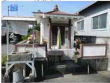
④ 10:55 中将姫ゆかりの得生寺で昼食 (京都で買った弁当)