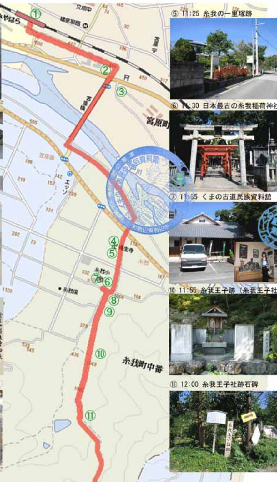
⑤ 11:25 糸我の一里塚跡