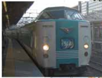
① 10:25 紀伊宮原駅を出発