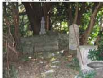
⑪ 11:40 小峠