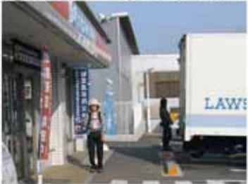
ローソン裏の井関王子跡伝承地