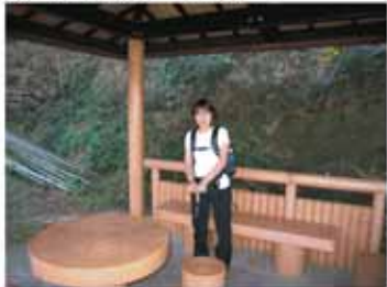
③ 12:10 東屋で休憩