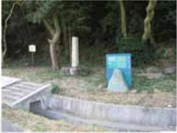
⑩ 14:50 高家王子跡(内原王子神社)