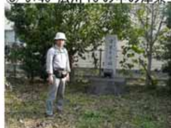
⑤ 10:10 河瀬王子跡