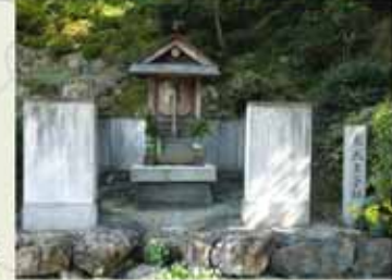
⑪ 12:00 糸我王子社跡石碑