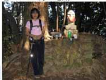
⑩ 11:20 大峠 (休憩)