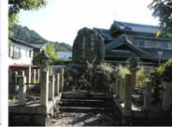
⑪ 14:10 紀伊国屋文左衛門の碑