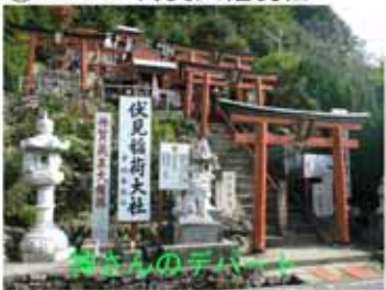
④ 10:00 丹賀大権現社