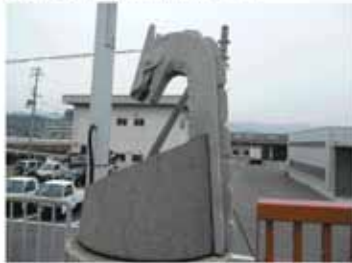
④ 13:15 岩間1号墳（有間皇子塚説がある）