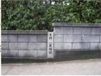
⑧ 14:20 今熊野神社