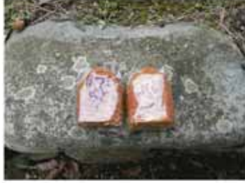
⑤ 13:35 岩内（焼芝）王子跡