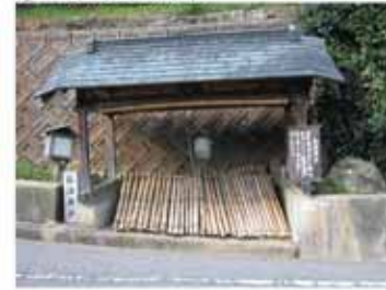
⑧ 13:05 弘法井戸