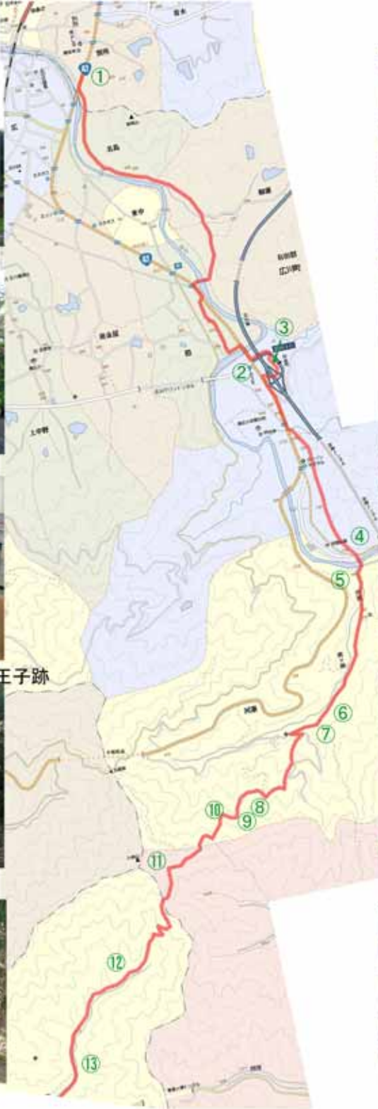
⑥ 10:25 東の馬留王子跡