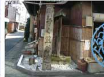
⑨ 13:40 立石の道標