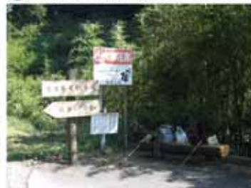
⑬ 12:15 金魚茶屋跡でやっと昼食 (途中はトイレが無かったので)