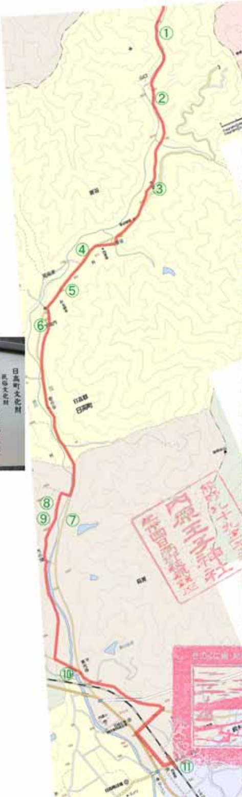
⑥ 13:40 (肩身の狭い)一里塚跡