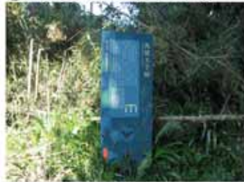
⑧ 11:10 痔の地蔵