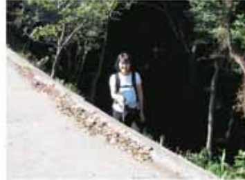
糸我峠から見る湯浅方面、遠方は鹿ヶ瀬の山