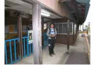
⑧ 始発駅から8分で終点の御坊駅に到着