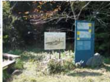
⑫ 11:55 現存する最長の石畳 (お腹が減ってママさん無口)