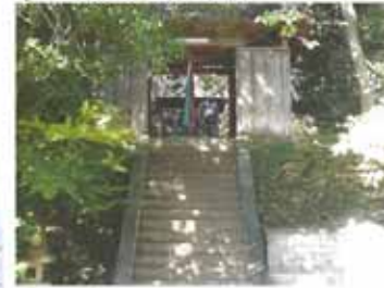
⑦ 12:55 逆川王子社