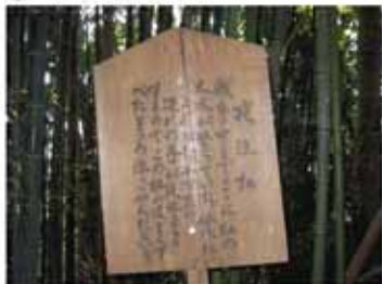
⑤ 12:35 夜泣き松